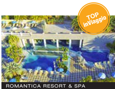
ROMANTICA RESORT &amp; SPA

Da Serrara Fontana, il paese più alto dell'isola, parte il sentiero che sale alla cima del Monte Epomeo (789 m), un grande masso di tufo verdastro in cui sono stati scavati l'eremo e la chiesetta di San Nicola. Il panorama è fantastico: Capri, Ponza e Gaeta a nord; a est, invece, sventa il Vesuvio, con il Golfo di Napoli e la Penisola Sorrentina.