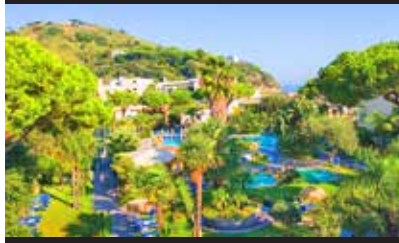
ALBERGO LA REGINELLA RESORT &amp; SPA