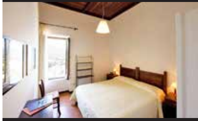
ALBERGO IL MONASTERO