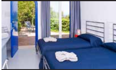
HOTEL DELLA BAIÀ