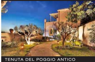
TENUTA DEL POGGIO ANTICO